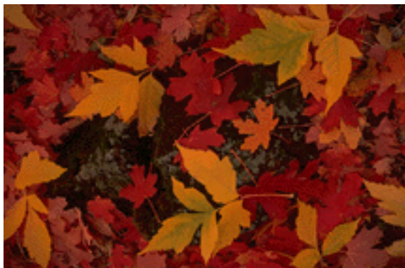
Høstens mange farger