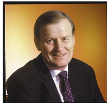
av Baard Sig. Bratsberg KrediNor AS